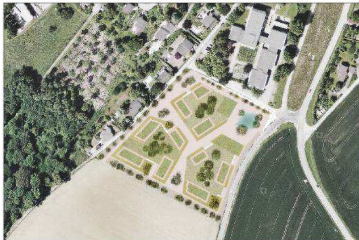
Les trois îlots de bâtiments se verront octroyer une surface de 100 m 2 pour des locaux communautaires. Dolci Architectes