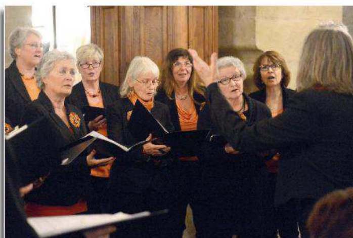
Les voix du chœur mixte, La Croche Chœur, ont résonné, à l'occasion du traditionnel concert de Noël, au Temple de Grandson, dimanche dernier.