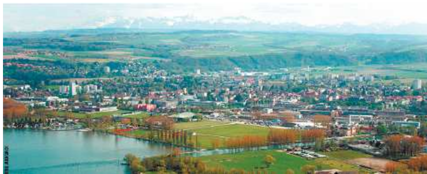
Site d'Yverdon Gare Lac

* Aide à fonds perdu ou prêt sans intérêt alloués par le canton (et la Confédération dans certains cas) en soutien au projet, avec le décret des pôles (de 1996 à 2008), la loi sur l'appui au développement économique ou la loi sur le logement.