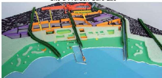
Image de synthèse des avant-projets, maquette Bauart Architectes, lauréat MEP, 2008

Informations dépourvues de foi publique. Des renseignements complémentaires concernant la disponibilité des terrains et des locaux sont disponibles auprès des associations économiques régionales.